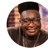
Prezy Présentateur radio à la RTBF notamment à The Voice Kids et les Niouzz mais également auteur, compositeur et interprète.

Entrée gratuite. Réservation obligatoire sur lejacquesfranck.be Retrouvez toute la programmation 2024 sur afilmsouverts.be